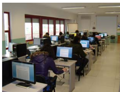
LABORATORIO DI INFORMATICA