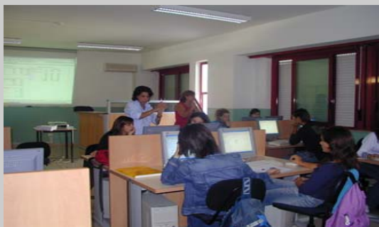
Laboratorio di impresa simulata

L'obiettivo perseguito è quello di far acquisire agli studenti sia conoscenze teoriche e applicative spendibili in vari contesti di studio e di lavoro sia abilità cognitive idonee a risolvere problemi, a sapersi gestire autonomamente in ambiti caratterizzati da innovazioni continue e ad assumere progressivamente anche responsabilità.