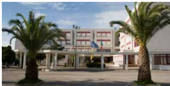
I.T.E.T Don Luigi Sturzo - Bagheria